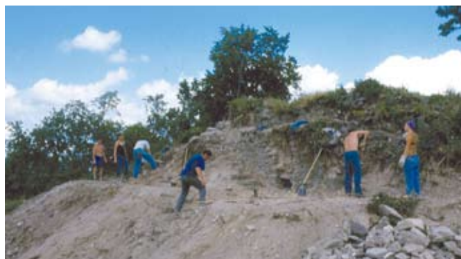
A déli torony és a lépcső környékének feltárása (Gál-Mlakár Viktor)