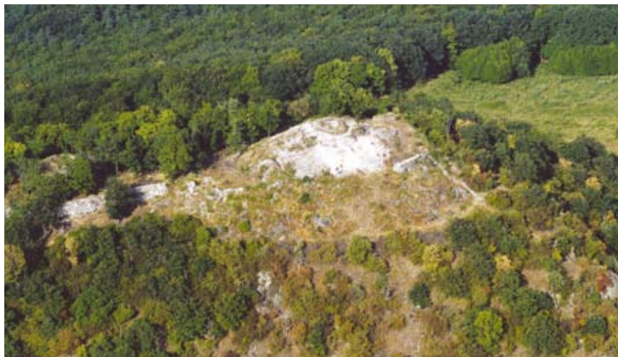
Solymos vára délnyugat felől ( www.civertan.hu )

Maga Solymos vára csupán kétszer szerepel írott forrásokban, a