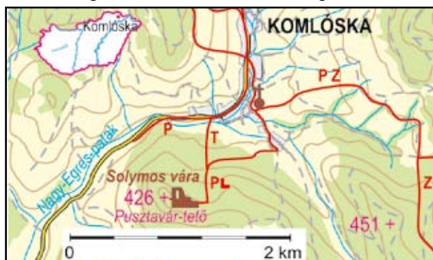
Solymos vár környéke

A 13. század végén bomlásnak induló sárospataki királyi erdőuradalom testébe benyúló nemesi birtoktest központja természetesen maga a névadó Tolcsva volt. A közvetlen birtokegyütteshez tartozott még Sára, (Vámos)Újfalu, Kútpataka, (Erdő)Horvati és Komlós(ka). Emellett 1288-ban váltja vissza a nemzetség a Baxa genus tagjaitól 180 márkáért Toronya birtokrészét. A ma