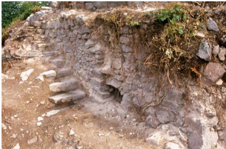
A déli toronyhoz a nyugati oldalon felvezető lépcsősor (Gál-Mlakár Viktor)

A torony nyugati oldalának kutatása során egy déli irányba ereszkedő lépcsősort tártunk fel,