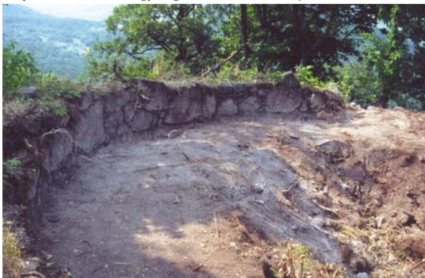
Az északi torony íves belső falsíkja (Feld István)

A vár ránk maradt csekély falai jelenleg pusztulnak. Bár Komlóska község önkormányzata szívesen vállalkozna védelmükre, sőt a vár egészének méltó bemutatására is, ehhez azonban nem rendelkezik megfelelő anyagi erővel. Helyreállításához és további kutatásához szükséges lenne egy állagmegóvási terv készítése, ami alapján pályázni lehetne a falkoronák megerősítésére, valamint épületeinek módszeres feltárára.