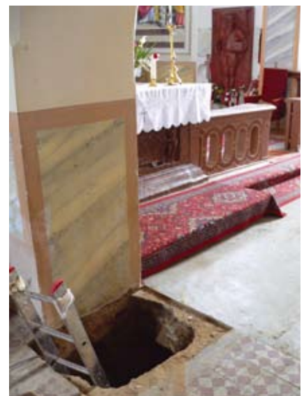
Az ásatási nyílás a régi szószerk helyén