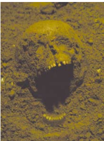
A szentély nyugati szélé alatt feltárt gyermekkoponya

A kutatás a szentély alatti területre is kiterjedt. Nem lehet ugyanis kizárni azt a lehetőséget, hogy a 17. században a protestánsok által szétműlt síremlékből ide helyezték át Dobó csontjait. A ma élő szájhagyomány is úgy tartja, hogy koporsóját a régi szentélyben, az oltár előtt rejtették el.