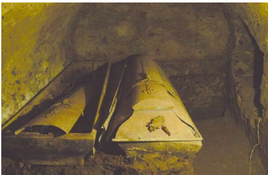
A kripta, két 18. század végi fémkoporsóval