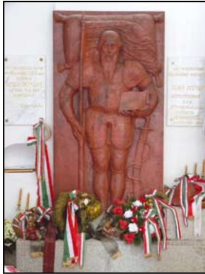
A Dobó szarkofág fedőlapjának másolata a szentélyben

sa és a régi templom északi falának részleges átépítése idején, 1914 tavaszán, az Ung Megyei Közművelődési Egyesület kezdeményezte Dobó