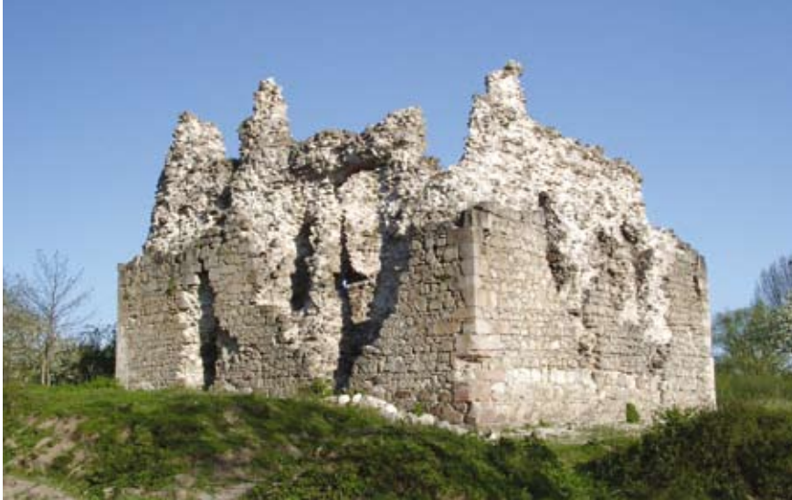
Szerednye várának lakótornya, Dobó halálának színhelye

neki. 1569 októberében a pozsonyi országgyűlésen I. Miksa király Dobót az uralkodó elleni összeesküvés vádjával letartóztatta és a pozsonyi