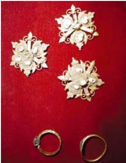
Az oltár alatti sírban talált 15-16. századi ékszerek

a sírkamráéhoz hasonló. A kriptában hagyott, 18-19. század fordulójára körül készített fémkoporsókban eltemetett személyekről a fennma-