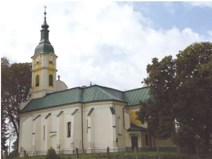
Dobóruszka temploma délkelet felől

A Felvidék keleti határánál, Nagykapostól délkeletre, 6 km-re fekszik a ma is magyarlakta Dobóruszka (Ruská) község. A Dobó család fő fészkeének számító falut a család első ismert őseinek, a 13. század közepén élt Pánki Ger-