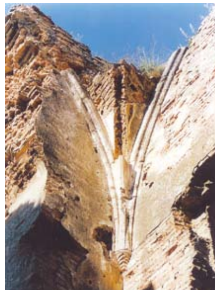
Gótikus boltív indítás a kaputorony első emeletén

Atya várának megtekintése után több lehetőség is nyílik a vártúra folytatására, avagy lezárására. A magyar-horvát határ irányába visszaindulva, feltétlenül érdemes Eszék előtt egy kis