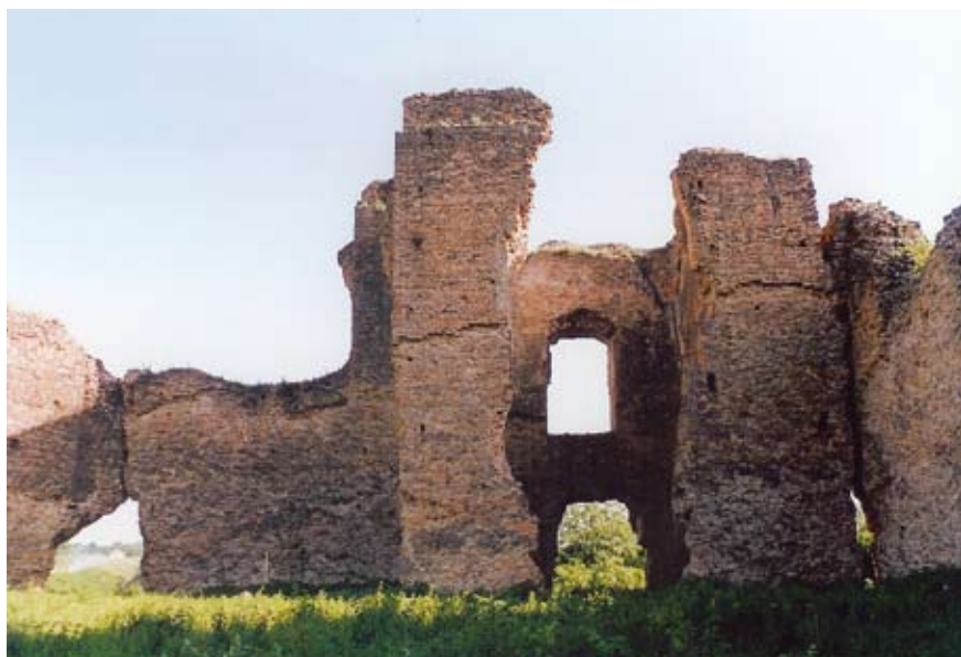
A kaputorony északról a csatlakozó falszakasszokkal

A különlegességeket kedvelő, merészebb várjárók Újlaktól délkeletnek fordulva, Berekszó és Marót erősségei felé vehetik az irányt. A szerb határon átkelve, 6 km megtétele után már feltűnik Berekszó (Berkasovo) község, melynek északkeleti végében, közvetlenül az út északi oldalán található a Turski Šešir-nek nevezett várhegy. A 15-16. században fennállt kétrészes várnak már csak sáncai figyelhetők meg, déli oldalát jelenleg áthatolhatatlan, tüskés bozót borítja. A Berkasztól 18 km-re délre fekvő Marót vára a Sztudba és a Boszut folyók találkozásánál, Marót (Morović) falu középső részén található. A 15. század eleje táján az a Maróti János bán emeltette, aki egykor Atya várát is átépítette. Bár romjai magánterületen állnak, a tulajdonos engedélyével bejárhatók. A Boszut folyóra néző keleti oldalának magas téglafalai Atya várának romjait idézik.