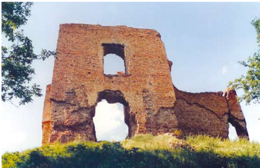
A kaputorony dél felől

Atya várához indulva a legcél-szerűbb a magyarországi Udvar határátkelőhelyen átlépni Horvátországba. Ezt követően egyenesen Eszéknek (Osijek) vesszük az irányt, majd a város déli végénél rákanyarodunk a Duna jobb partja mentén vezető 2-es főútra, amelyről nem szabad letérni, mivel egyenesen úticélunkhoz vezet. 20 kilométer megtétele után érjük el Borovo ipari települését, melynek szélén a középkorban a „castrum Boroh”-nak nevezett vár emelkedett, de ennek ma nyoma sincs. Ezután Vukovárra érkezünk. A városban, a mai ferences kolostor helyén állott egykor az itteni vármegyének nevet adó Valkó vára. A főúton haladva átszeljük Vukovárt, majd Sotin településre érünk. Itt is volt egy vár valaha, amit Szata várának neveztek, de manapság sajnos ezt is hiába keressük. Mikorra már-már úgy éreznénk, ez az elpusztult várak útvonala, ahol a várromok rajongói számára nemigen akad látnivaló, Sarengrád (Šaregrad) falu