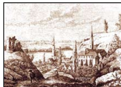
A romok és a település 1870 körül