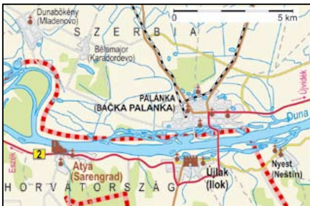
Atya várának környezete