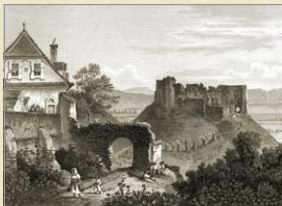
Földvár romjai a 19. század közepén (F. Foltz metszete, L. Rohbock rajza alapján)