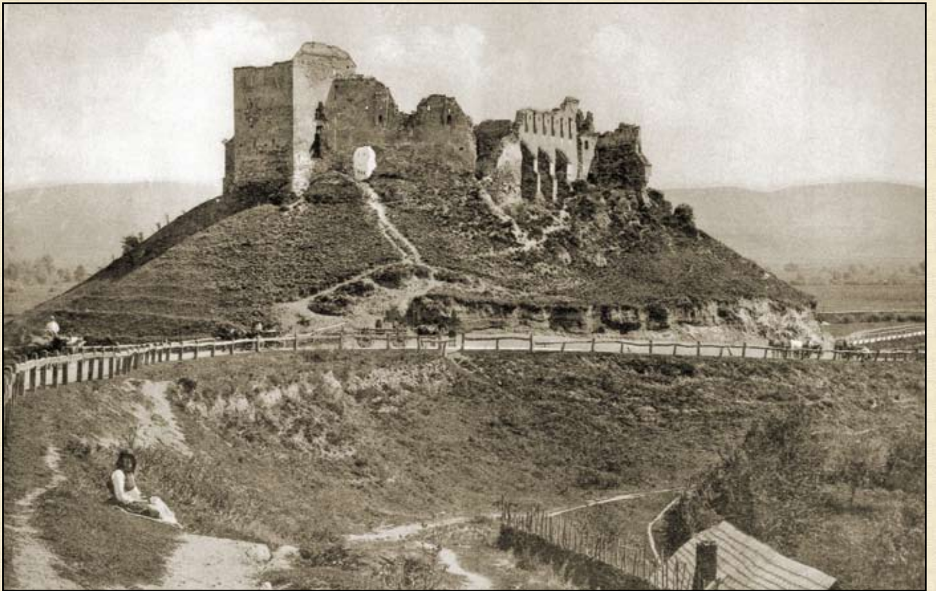
Földvár látképe (Fotó: Schuller & Sohn, 1908)