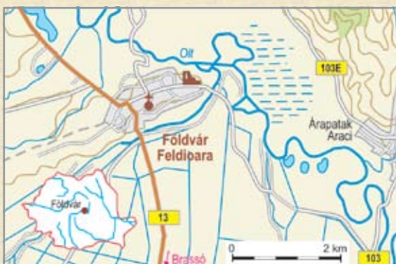
Földvár és környéke