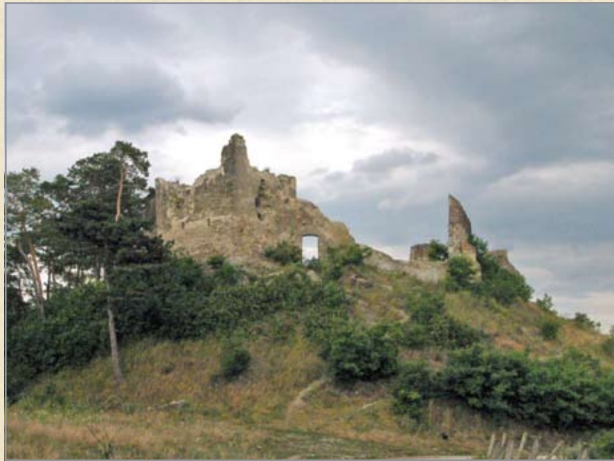
Földvár látképe délnyugatról

A galéria archív fotóján látható földvári erősség számos hadiesemény tanúja volt. 1345-ben a Székelyföldre dúló tatárok foglalták el. 1599-ben Vitéz Mihály havasalföldi fejedelem serege, majd 1604-ben Basta generális zsoldoscsapatai elől e