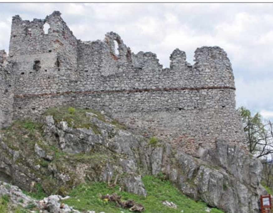
A kapuvédő erődítmény a vár nyugati oldalán