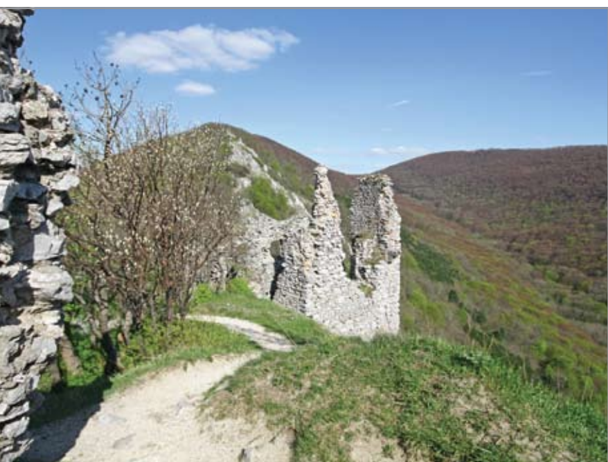
Kilátás a felső várból a Záruby csúcsa felé

között meghúzódó erősséget kényelmes lakhellyé tenni, és az akkoriban megjelenő ágyúkkal vívott hadviselésnek ellenálló várrá alakítani. Ám így sem lehetett a 16–17. században igazán jelentős, korszerű erősség. Az ostromló számára a legnagyobb akadályt a hozzá vezető fárasztó út, a hegy meredeksége jelenthette.