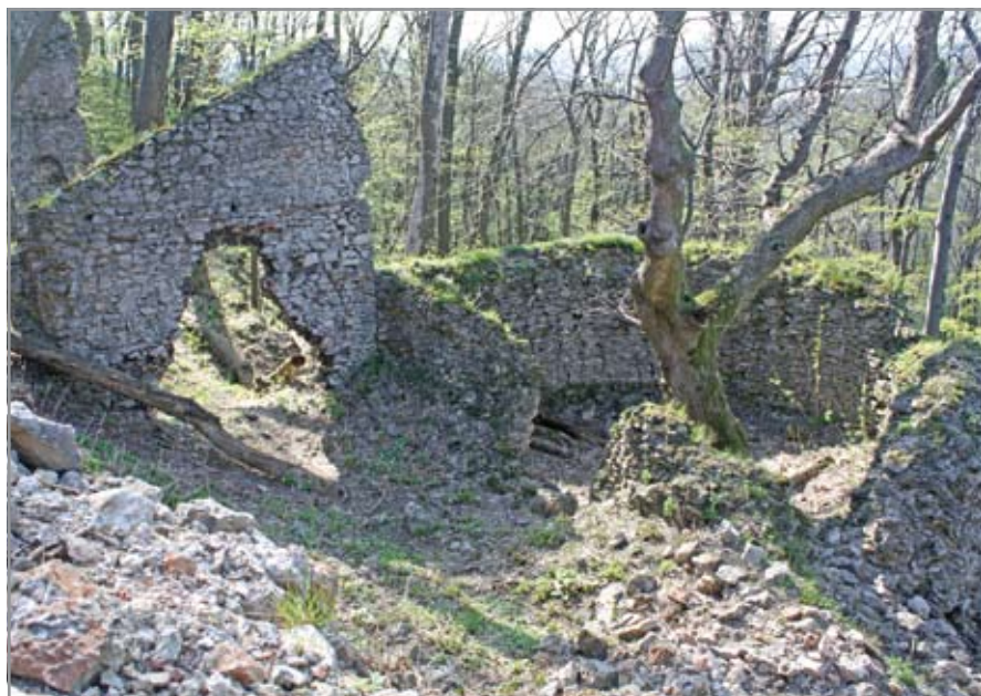
Az alsó vár falmaradványai a fák között