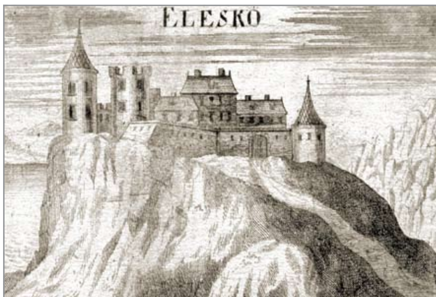
Éleskő várának ábrázolása a 18. század elején