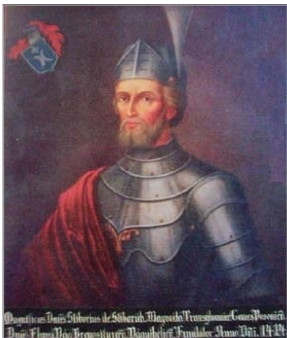
Stiborici Stibor erdélyi vajda (1348–1414)