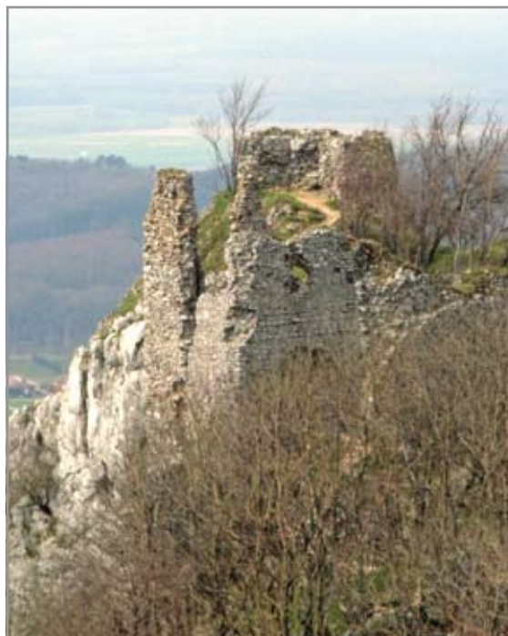
A felső vár épületmaradványai délkelet felől