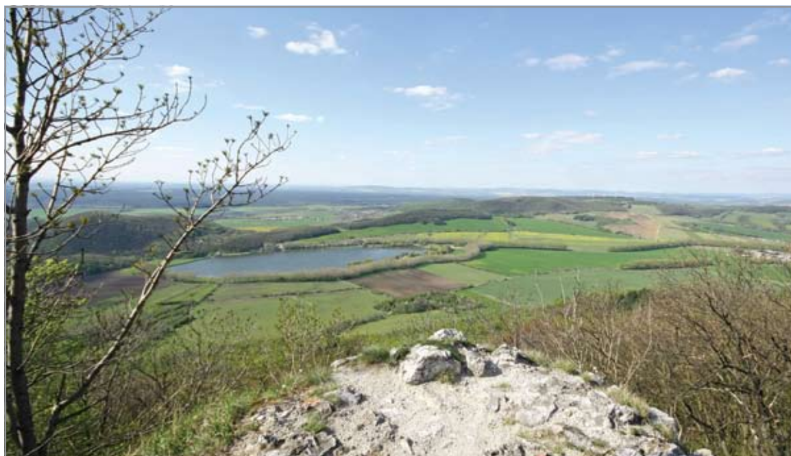
Kilátás a felső vár legmagasabb pontjáról a Bikszárdi-víztározóra és Korlátkő vára felé

Hinni szeretnénk Éleskő-vár sorsának jobbra fordulását. Kívánjuk, hogy szélmotorok, újabb és újabb tulajdonosok helyett kutatók, önkéntes munkások, turisták népesítsék be a várat. 🍷