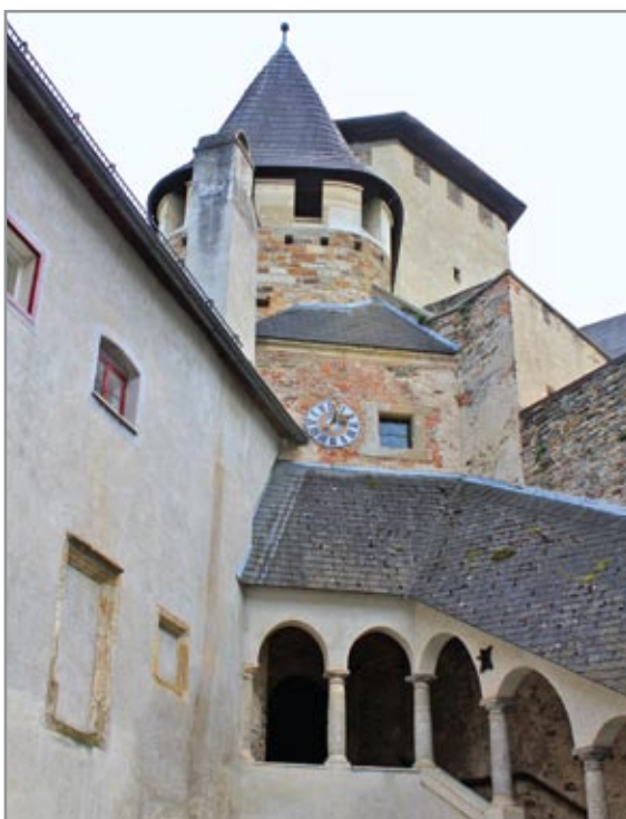
Feljárt a középső- és a felsővárba, hátról az öregtorony