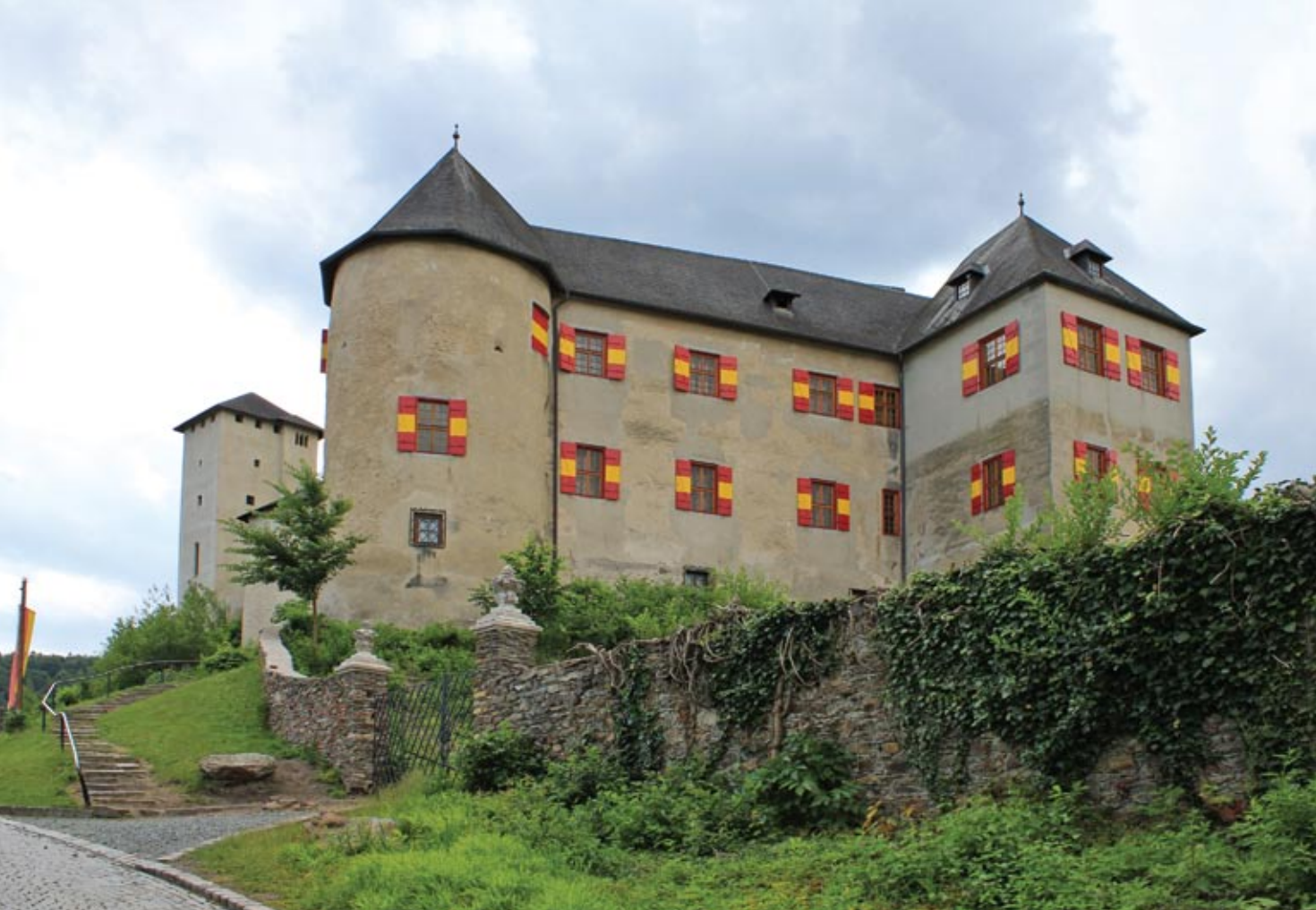
Az alsóvár északról, balra hátul a kápolnatorony