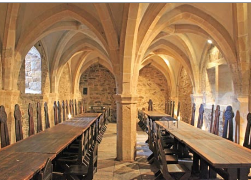
A lovagterem részlete