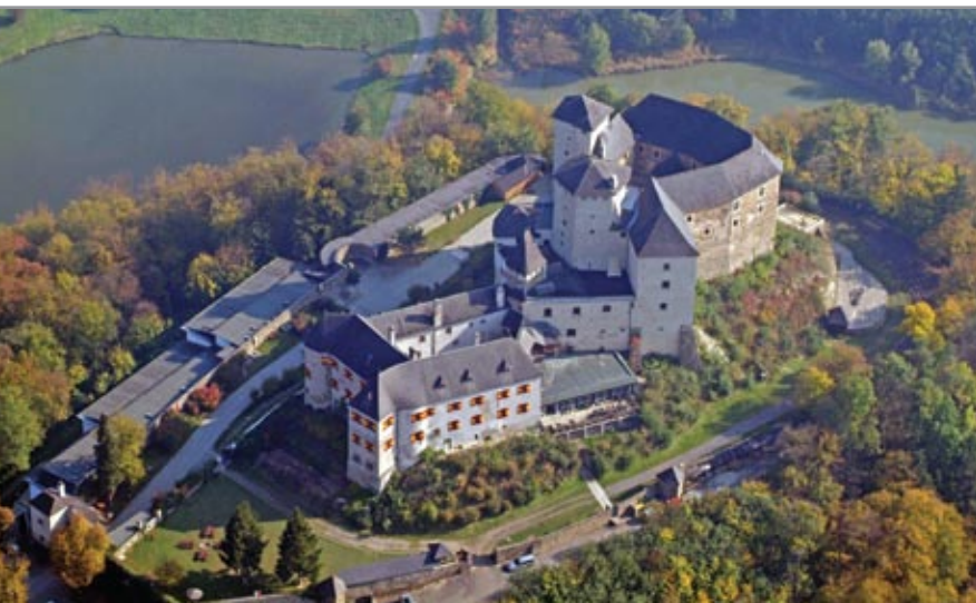
Léka vára madártávlatból