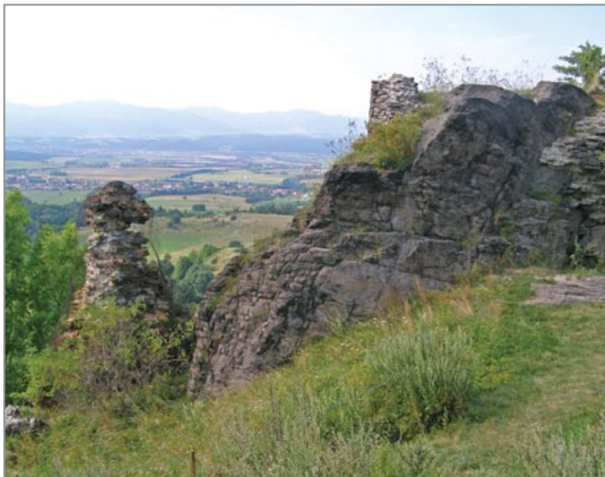
A felső vár sziklája délkeletről