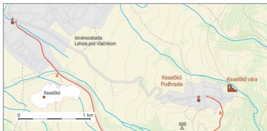
A vár Keselőkő (Podhradie) falu keleti szélé fölémelkedik

Romjai a 19. századi metszeteken még magasan álltak. A 20. század elején, a Borovszky-féle „Magyarország vármegyei és városai” sorozat Nyitra vármegyei kötetében közölt fotón már jóval kevesebb látszik belőle. Ennek okát is leírták: „a romokat nemcsak az idő viselte meg annyira, hogy ma már csak néhány falrészük látható, hanem a falu lakosainak kegyeletlensége is, akik a vár falában kitűnő építkezési anyagot látva, minden ellenőrzés