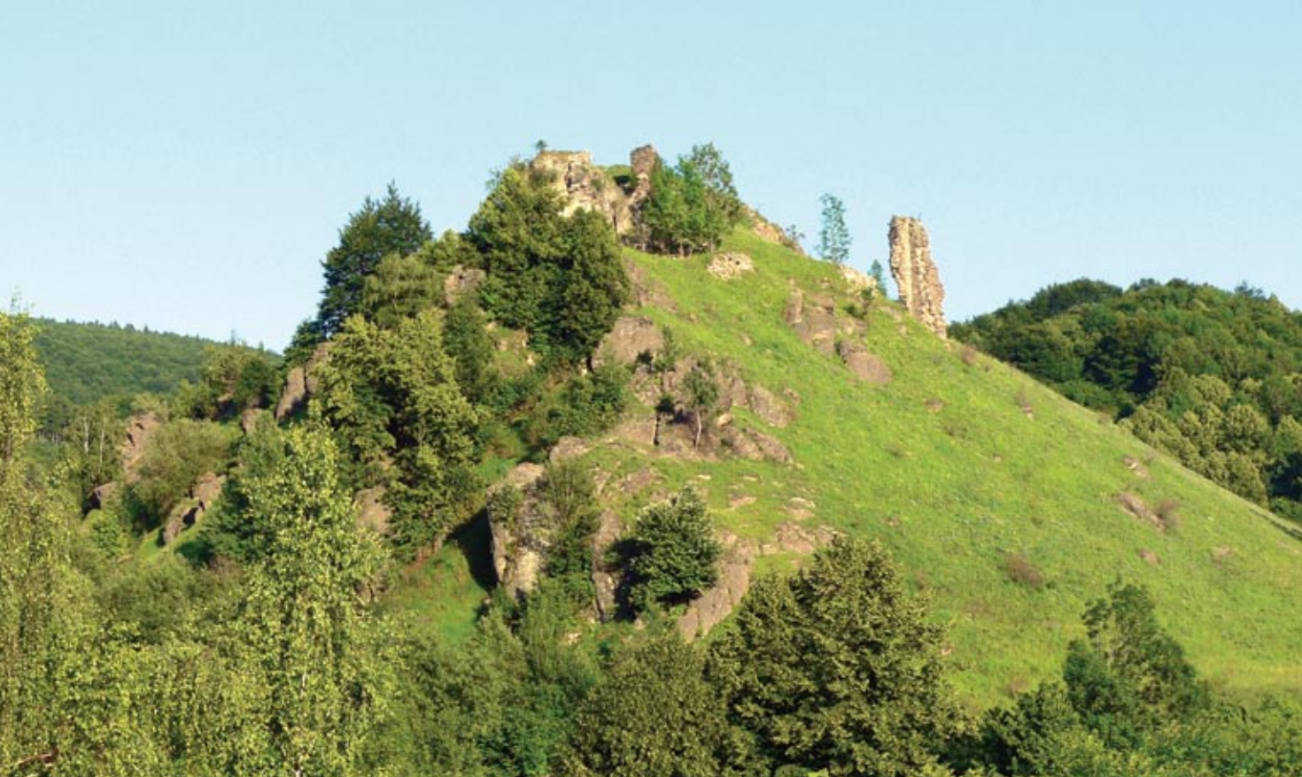
Keselőkő romjai a várhegy északnyugati oldalán