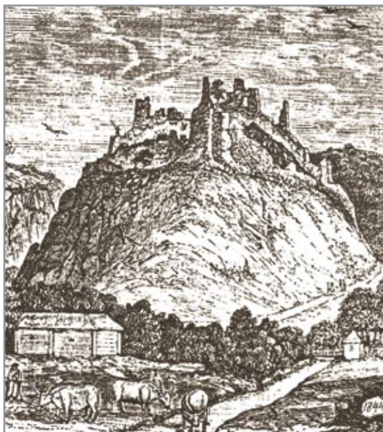
Keselőkő vára a 16. században (König Frigyes rekonstrukciós elképzelése)