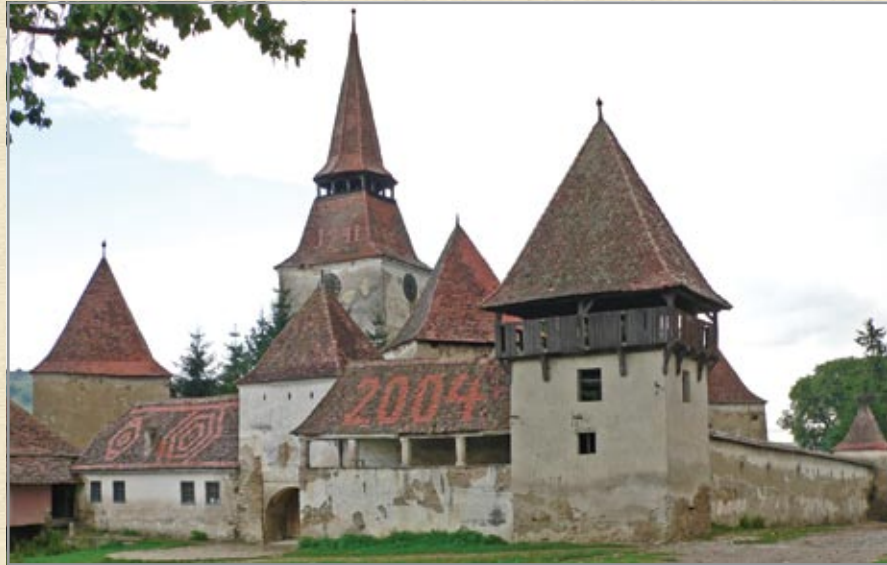
A templomvár látképe délnyugat felől

Erked lakóit a középkor végétől csapások és balserencsés fordulatok sorozata érte, amelyekből erős templomváruk sem védhette meg őket. 1604-ben Basta generális súlyos hadisarcot vetett ki a falura, melynek kifizetése után a hajdan virágzó település elszegényedett. 1608-ban általános ínség uralkodott, a lakosok a szomszédos magyar faluba jártak bérmunkára. 1663-ban Apafi Mihály udvarnépeinek beszállásolásakor a „szövetséges” török csapatok okoztak jelentős károkat. 1748. augusztus 28-án majdnem az egész falu leégett: 86 ház, a templomvár és az abban tárolt teljes terménykészlet elenyészett. 1814-ben megint tűzvész pusztított, 105 ház semmisült meg. 1848-ban, a szabadságharc hadieseményei során a települést felgyújtották. A lakosság