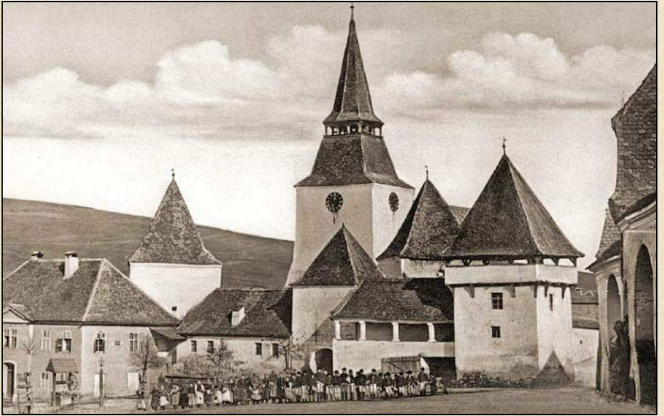
Ekerd templomuára a 20. század elején