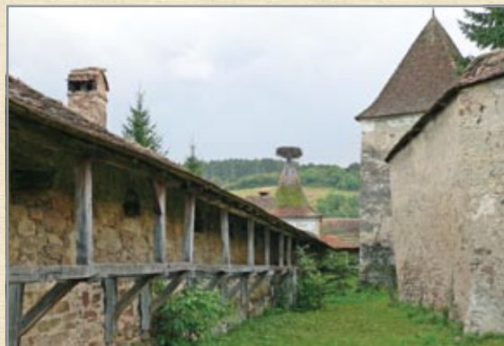
A külső várfal a gyilokjáró maradványával