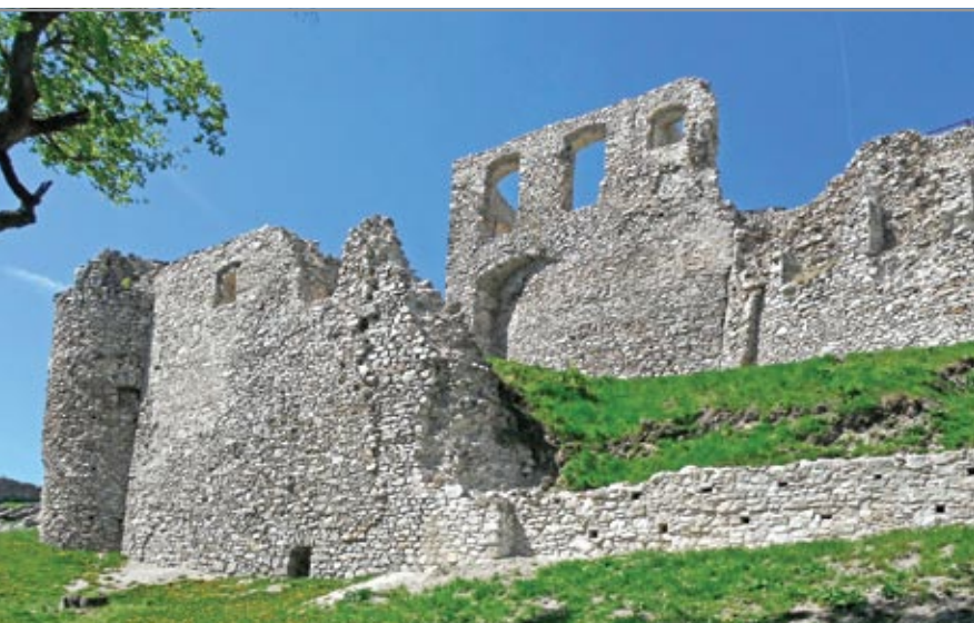
A délkeletről készített felvételen előtérben az ágyútorony romjai, mögötte a ciszterna köré emelt épületek figyelhetők meg

tikai térképe segíti a tájékozódást. A feliratok között örömmel fedeztünk föl magyar nyelvűt is, amivel bizony elég ritkán találkozhatunk.