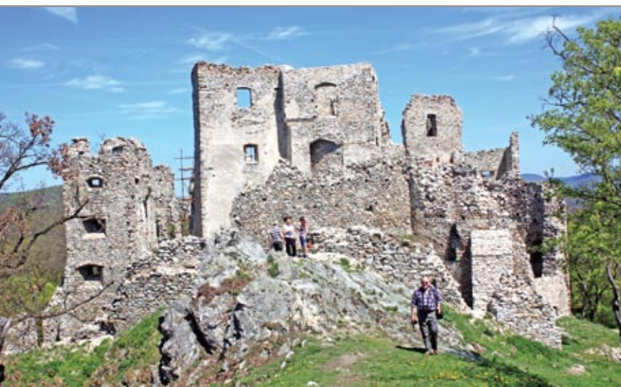
A vár látképe délnyugatról. Középen magasodik a felső vár tömbje