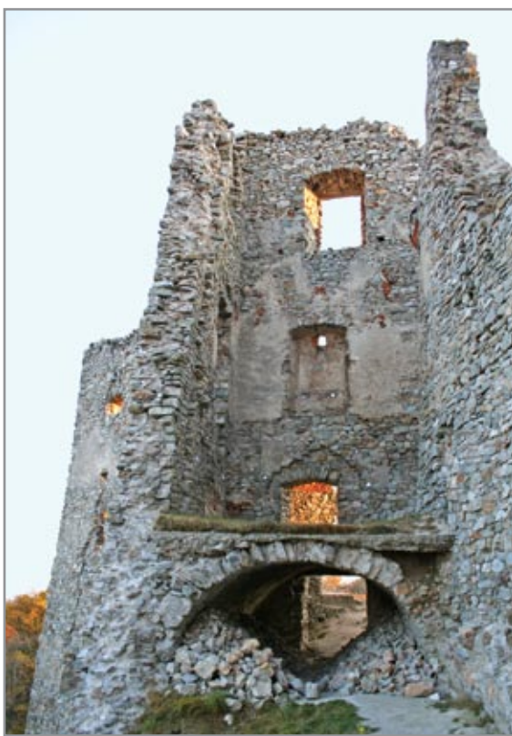
A keleti reneszánsz palota külső fala hosszú szakaszon leomlott. A fotón a viszonylag épen maradt része látható