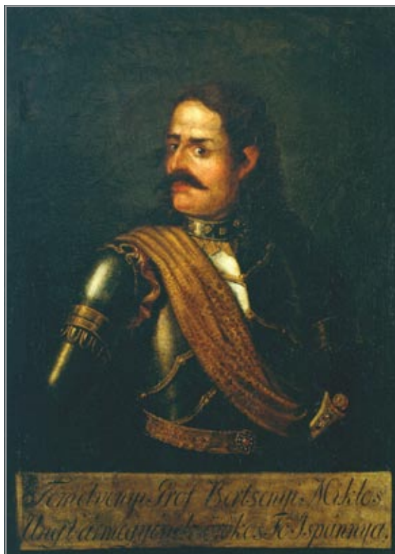
"Eger! Eger! Csak nem jó nekünk EGERésznünk!" – írta 1704 tavaszán Bercsényi Miklós (1665–1725) II. Rákóczi Ferencnek a vár hiábavaló lövetése kapcsán.

A vár első parancsnokává Rákóczi azt a Ráti Gergely ungi nemest nevezte ki, aki kemény kézzel örködött a kapitulációs szerződés betartása felett. Maga a későbbi vezérlő fejedelem a tragikus nagyszombati vereség után 1705 januárjának a végén érkezett Egerbe, amely egyik legkedveltebb tartózkodási helye, főhadiszállása lett. Amiként ő maga nevezte: „az ország közepe”. ♡