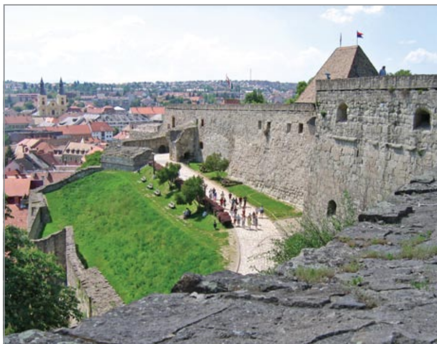
A déli falszoros, háttérben a ma is használatos 16. századi Varkoch-kapuval