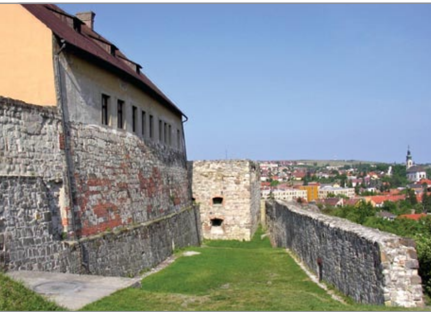
Az északi falszoros, a kép közepén a Tömlöcbástya lőrésével

ban készült kimutatás szerint az egeri hadszertár fontosságát tekintve még mindig a második kategóriába tartozott. Személyzete pedig egy hadszertárnokból és nyolc tüzérből állt, és ebből csak hat volt jelen.