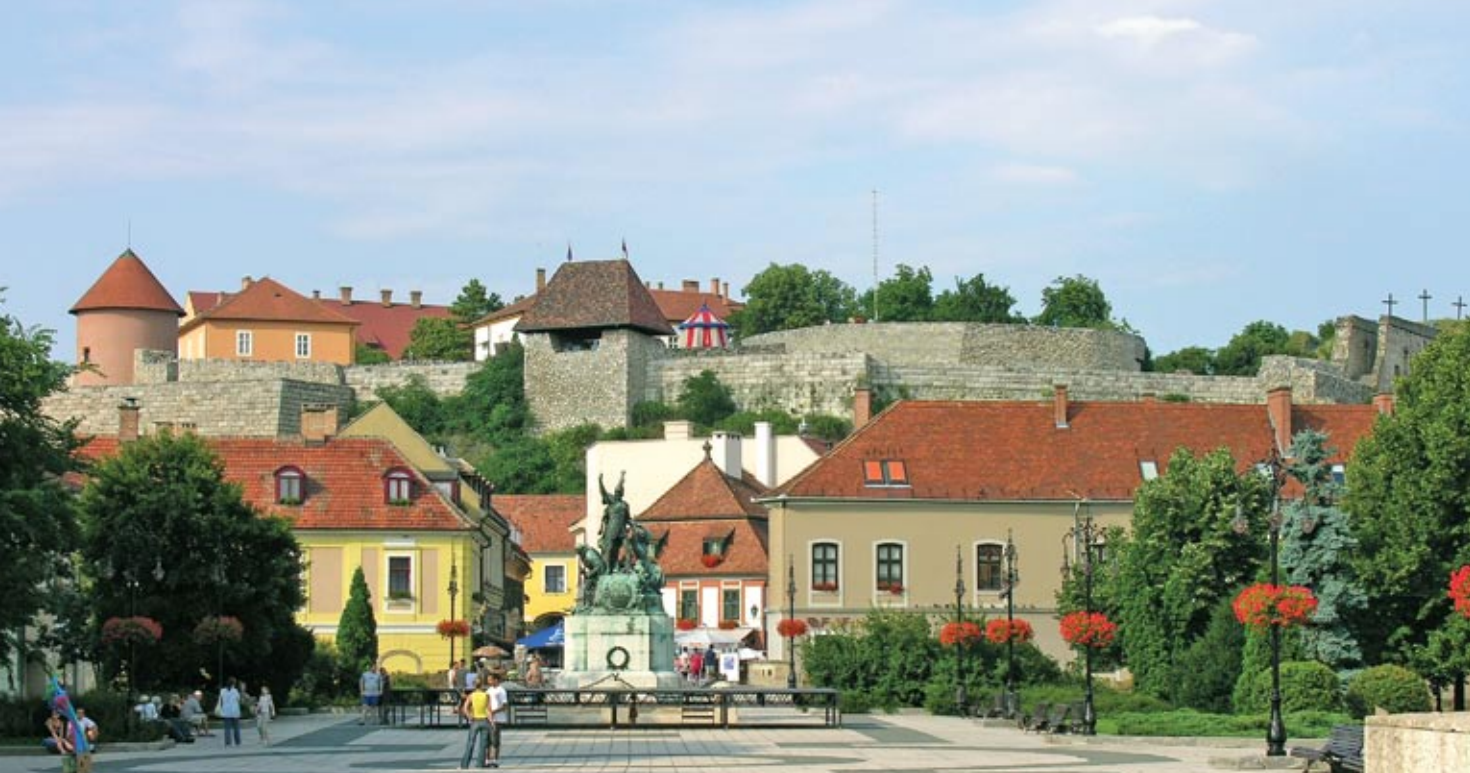
A vár déli látképe, az előtérben Dobó István szobrával