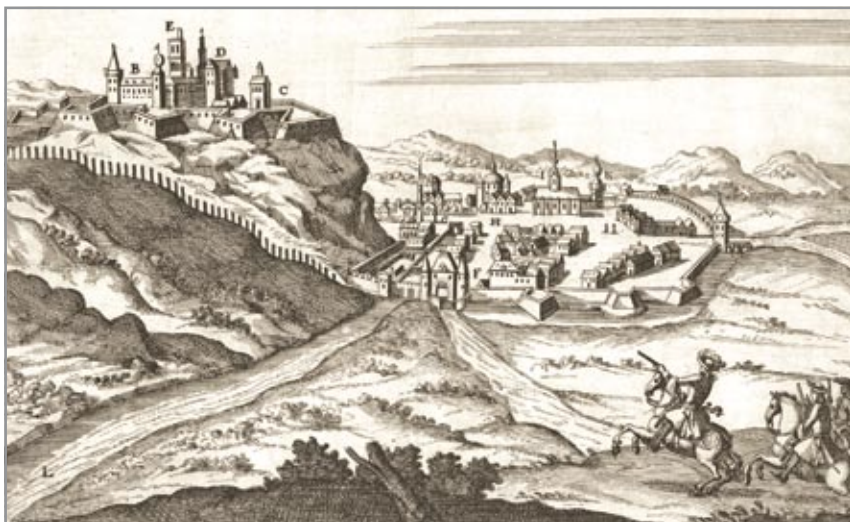
Eger korabeli ábrázolása Johann Philipp Stendner (1652–1732) metszetén (18. század eleje)