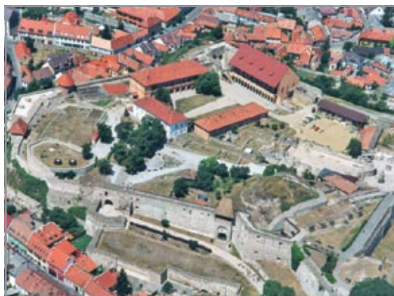
A vár látképe egy délkeletről készített légifotón