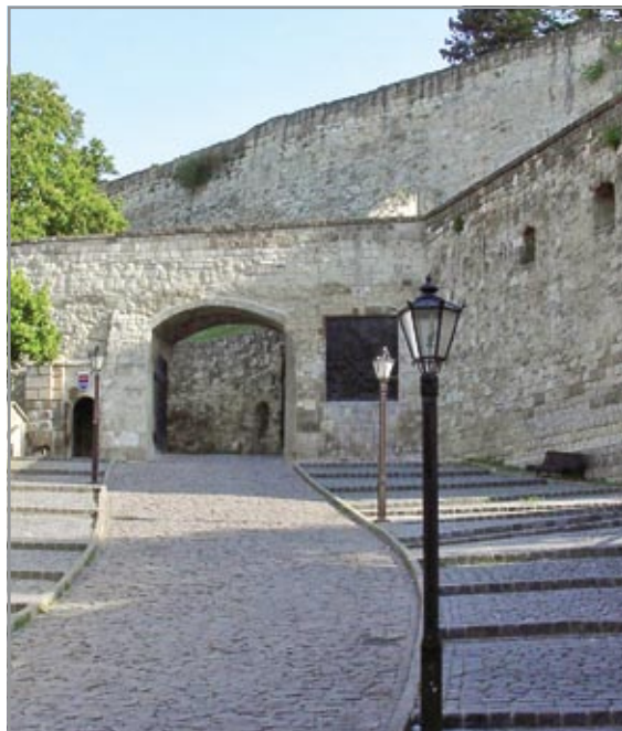
Az újjáépített Dobó-bástya környezete