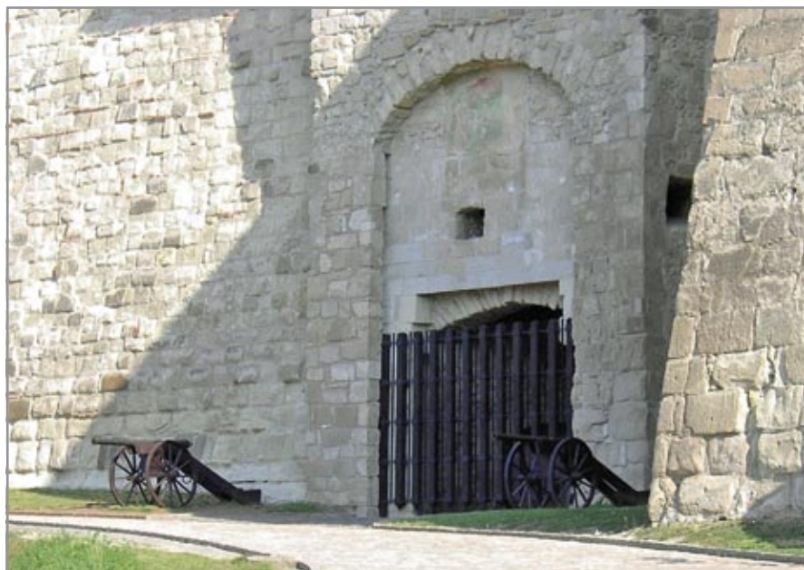
A déli falsorosban látható Hippolit-kapu volt a középkori vár kapuja, használatával az 1540-es években hagytak fel