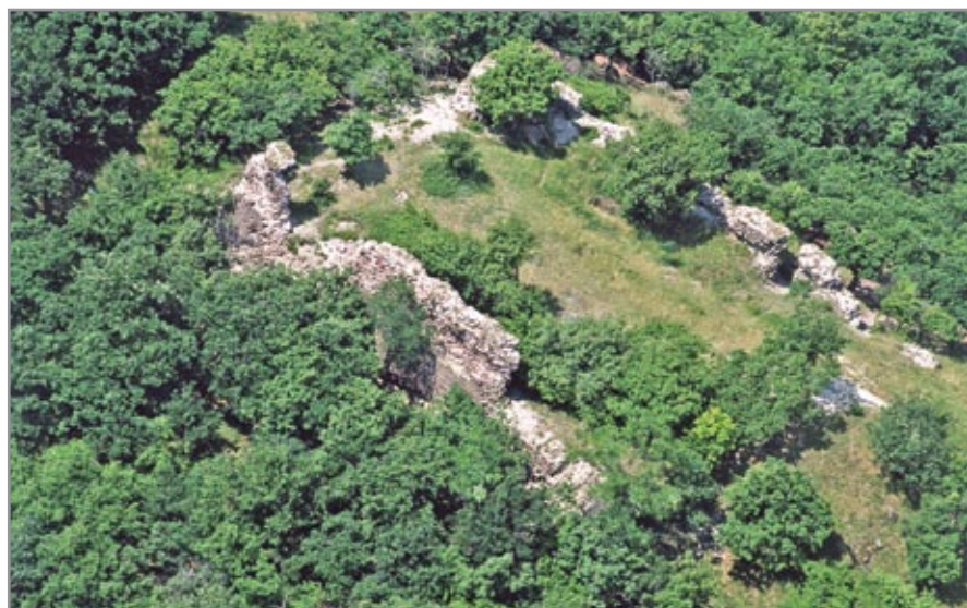
Markaz várának madártávlati képe keletről