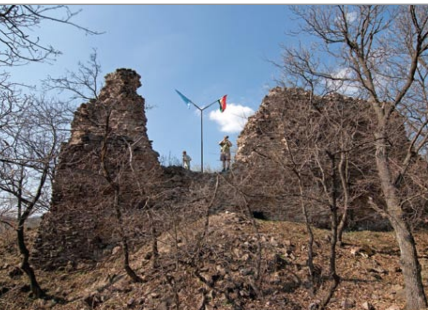
A vár délkeleti oldalának még magasan álló falmaradványai