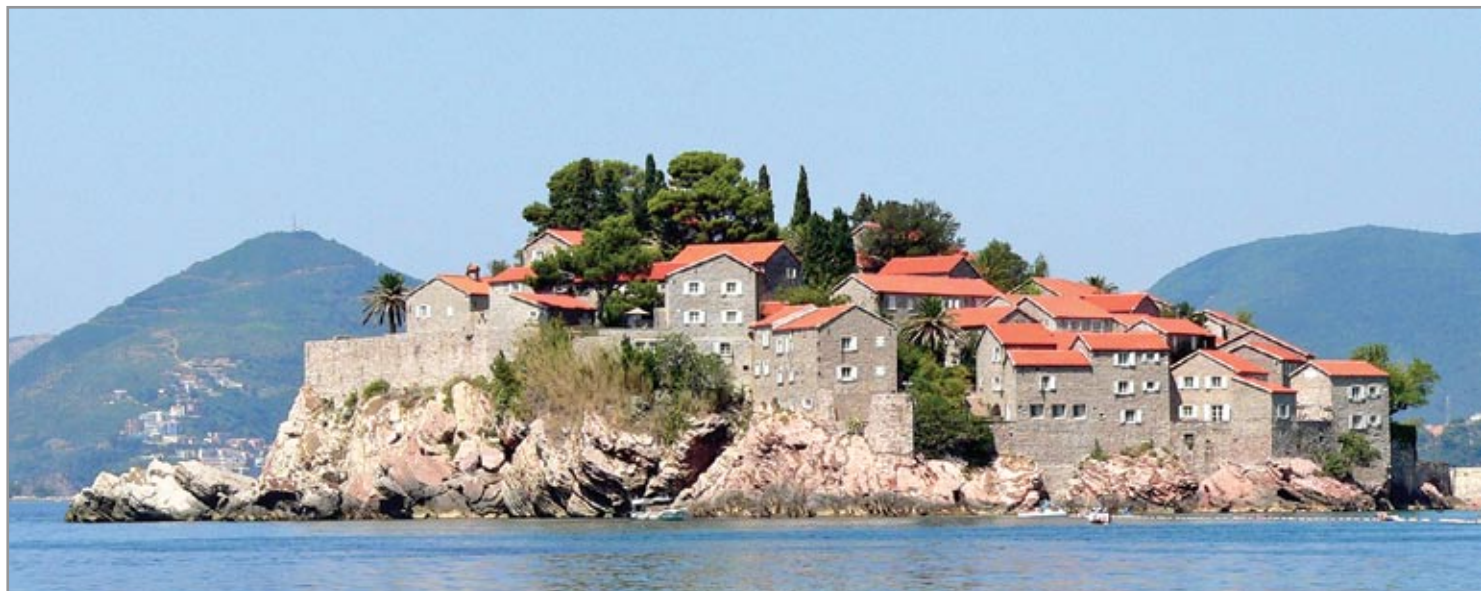
Sveti Stefan szigetét a szárazföld felől félkör alakú torony, valamint körben lőréses várfal védte. Néhány falszakasz napjainkig fennmaradt