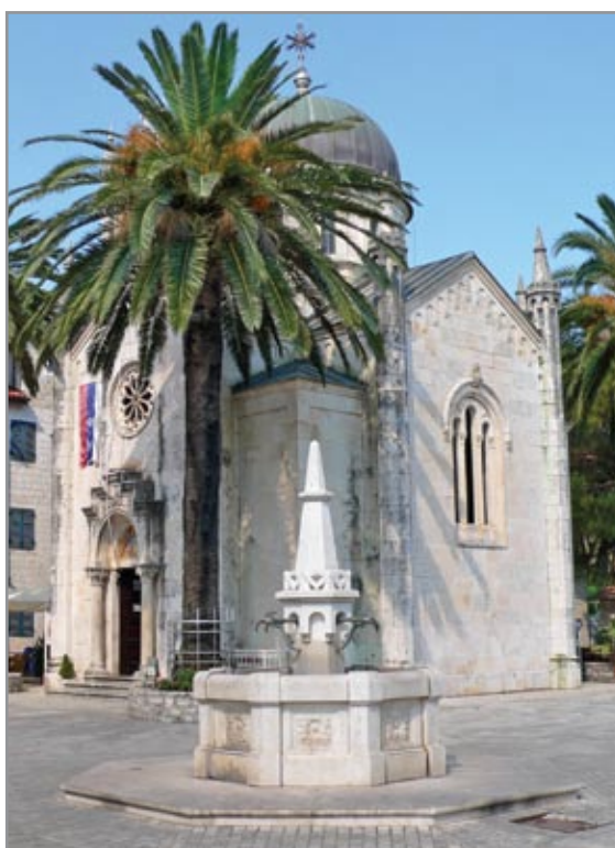
A 19. század végén emelt, bizánci, iszlám és gótikus stílusjegyeket egyaránt felvonultató Szent Mihály Arkangyal-templom Herceg Novi Óvárosának főterén áll

Perast messzire ellátzó, híres harangtornyának építési munkálatai 1691-ben fejeződtek be, ez a „nevezetesség” a helyi polgároknak 50 ezer arany dukátjukba került