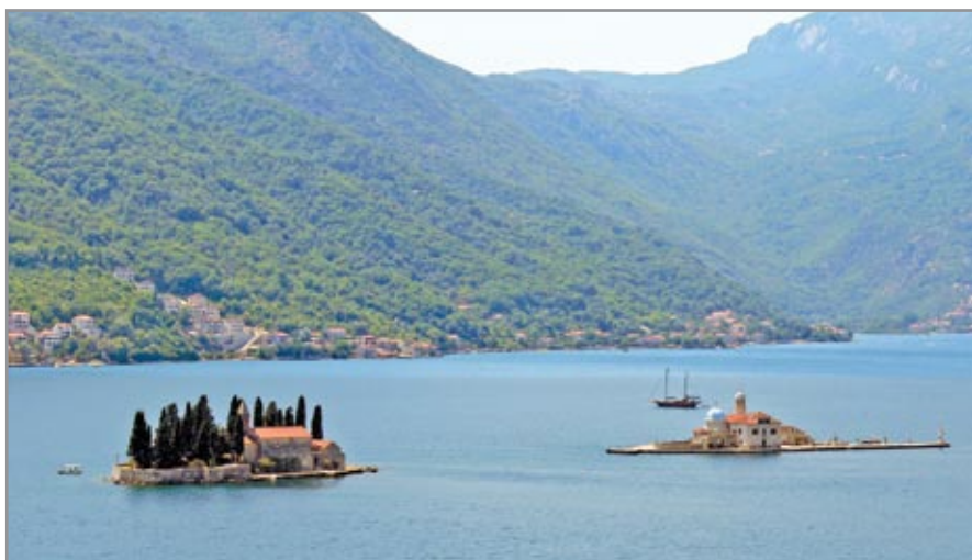
A Szent György-sziget (balra) és a Szirti Madonna-sziget (jobbra) a Kotori-öböl talán legtöbbet fényképezett látványossága

A Kotori-öböl déli végébe települt Kotor (olaszul Cattaro) Óvárosa ma a világorökség része. Lakták illír törzsek, rómaiak, a 13. században a szerbekhez, 1385-től pedig a bosnyák királysághoz tartozott. 1391-től önálló köztársaság, amely az egyre növekvő török veszély miatt 1420-ban Velence fennhatósága alá helyezte magát. 1807–1814 között a franciák, majd ezt követően az Osztrák-Magyar Monarchia is