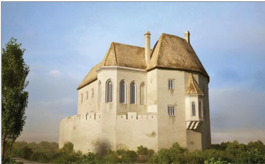
A simontornyai vár északi szárnya a 16. század elején

először fapalánkkal körülveve kastéllá, majd kőfallal várrá alakította. János fiai már a század közepe után fejezték be az építkezést a belső vár felépítésével.