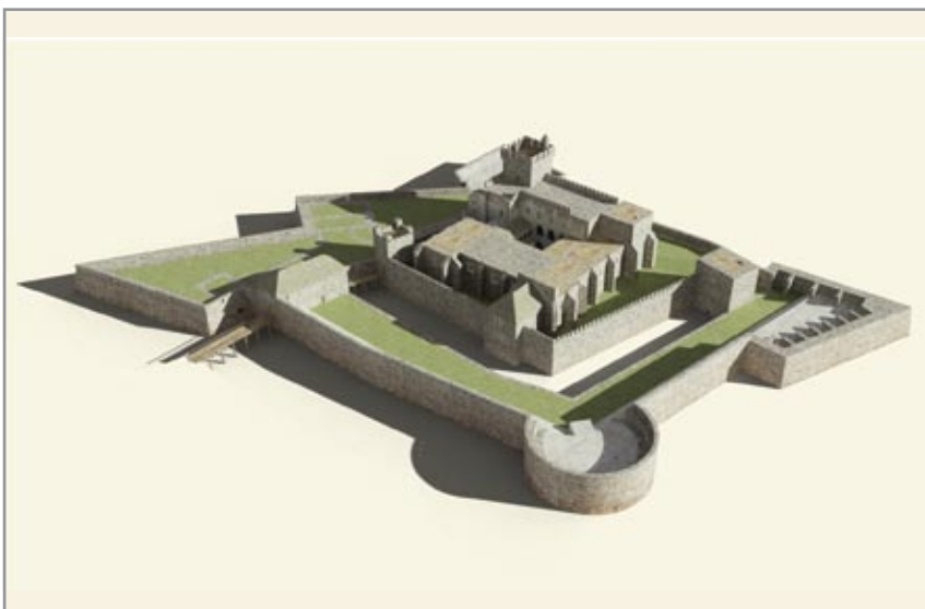
A tatai vár 1586 körül