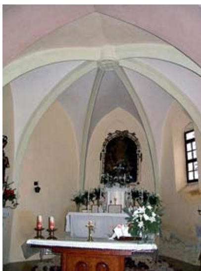
A gótikus szentély