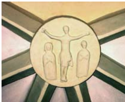
A szentély boltozatának záróköve

A 14. századi eredetű, keresztboltozattal fedett szentélye a hatszög három oldalával záródik. A boltozat zárókövén kálváriajelenet van, a megfeszített Jézus és két női