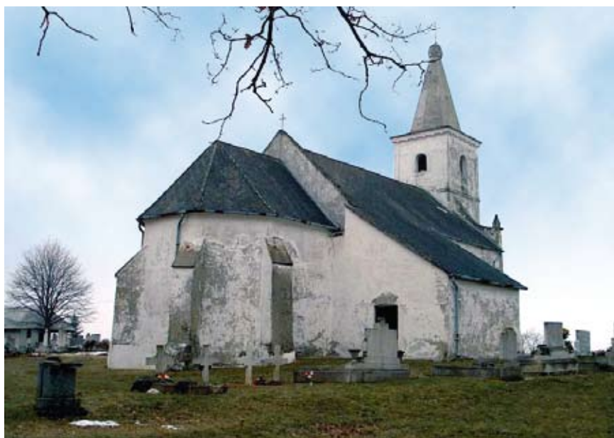
A gótikus szentély támpillérei

A templom és torony legutóbbi felújítására, a hívek és a Műemlékvédelmi Hivatal anyagi hozzájárulásával, 1955 és 1964 között került sor, melynek