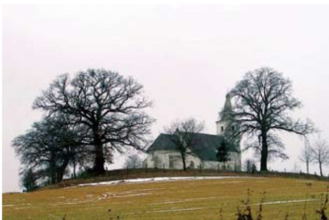
Hosztót római katolikus temploma

Temploma a középkorban anyaegyház, 1333-35-ben papja Tamás, 30 széles dénár pápai ti-