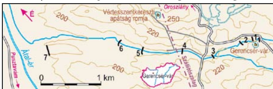
A vár környéke a halastavak gátjaival