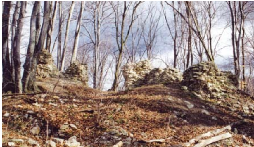
A vár csekély maradványai

A Vértes hegység mélyén, a nyugati szélétől 3 km-re, sűrű erdőben bújik meg Gerencsérvár maradványa. A hegység ma már lakatlan terület. A bányák is többnyire abahagyták működésüket, az általuk okozott súlyos sebeket, csupasz terü-