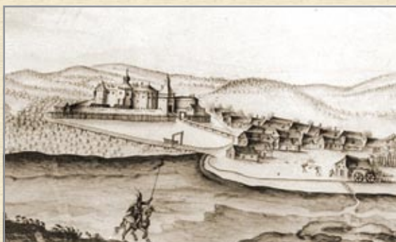
Szentgrót várának látképe (Le Dentu rajza, 17. század vége)