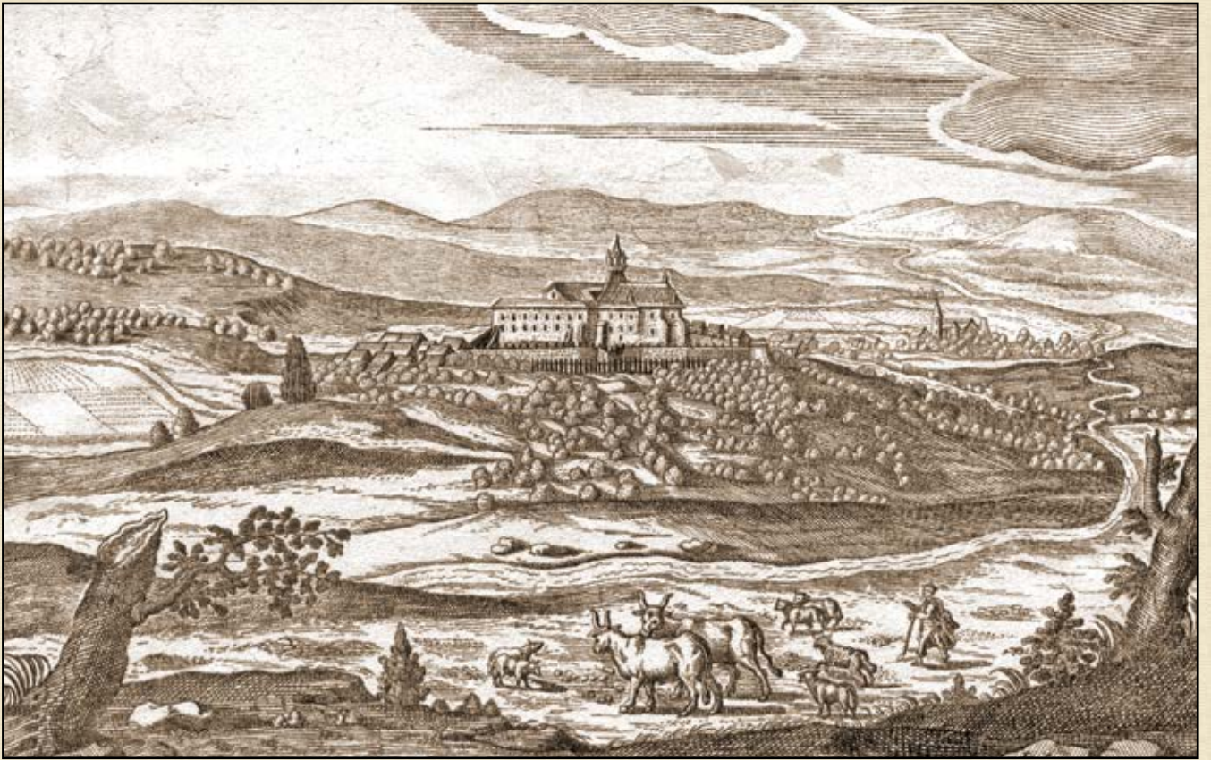
Szentgrót vára (Lucas Schnitzer rézmetszete, 1665)