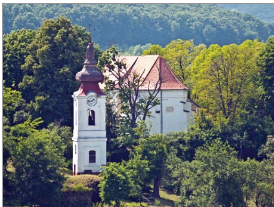
Alsópetény középkori eredetű temploma és a barokk harangtorony a helyreállítás előtt