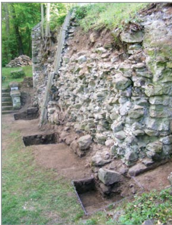
A Werböczy-kúria falmaradványai a statikai szondákkal