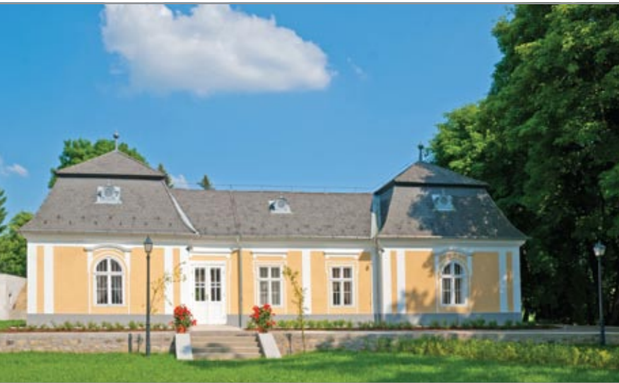
A Prónay-kastély Kiskastélyának homlokzata a Nagykastély felőli oldalon