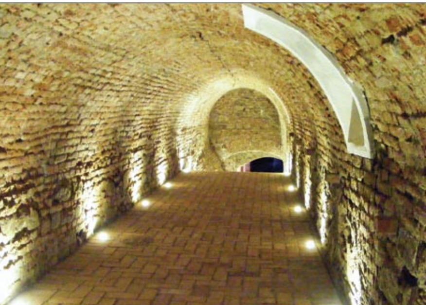
A Nagykastély pincéjének hosszú folyosója a helyreállítás után

szempontok teljes figyelembe vételével történik. Megújult a Nagykastély és a Kiskastély is, ezek reprezentatív helyiségei korhű bútorokkal berendezve szolgálnak esküvők, céges rendezvények, vagy éppen műemléki-örökségi szakmai szimpóziumok helyszínéül. A rendezvények között szerepelt az idén már másodszor megrendezett Pünkösdi Művészeti Fesztivál is, ahol főként zenei programok várták a látogatókat. A Nagykastélyban kialakított nászutas lakosztály és a Kiskastély igényesen berendezett, átriumos tér körül elhelyezkedő lakóterei szálláshelyként is hasznosíthatóak, de az ide látogató vendégek szállásigényét alapvetően a most felépült Vendégház szolgálja ki. Ez a majorsági épület egy részének helyén, a kastélyegyüttes stílusához igazodva készült el. Az építészettörténeti- és falkutatások ugyanis azt mutatták, hogy az egykor nagy kiterjedésű majorsági épületek nagy része elpusztult, csak egy kisebb épületrész őrzi építészeti és értékes elemeket. Így a 20. században épült jellegtelen, rossz kivitelezésű épületrész elbontásra került, míg a majorsági épület értékes része az új épületszárnyal együtt szolgál vendégházként. Emellett új elemként jelent meg a Fürdőház, amely a kor igényeinek megfelelően a szálláshelyet egy kis wellness-központtal teszi még vonzóbbá.