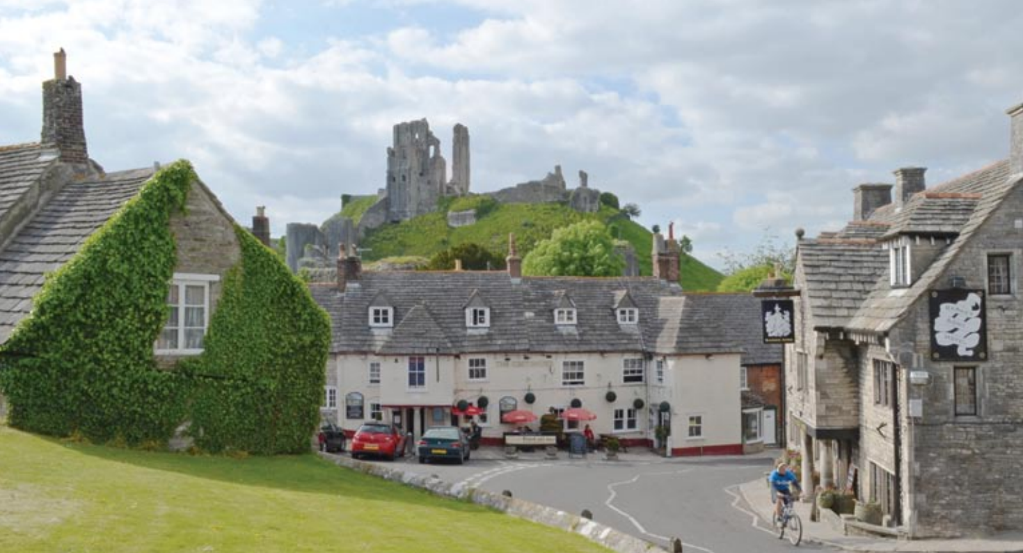
A vár romjai Corfe falu házai fölé magasodnak