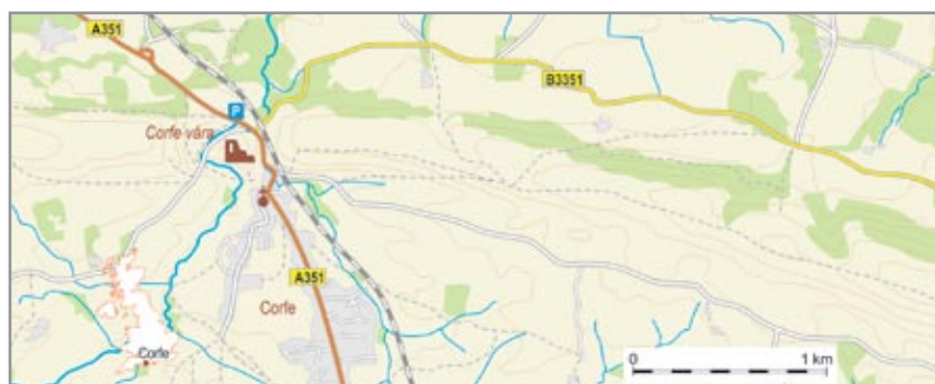
Corfe várának megközelítése

előttünk magasodó dombtetőt felhő burkolta be. Én már tudtam, hogy a szürke felleg Corfe várának még most is tekintélyes romjait rejt, hiszen néhány héttel korábban verőfényes időben jártam erre. Bizton állíthatom – bár útitársaimat ez nem vigasztalta –, hogy a romok már távolról is lenyűgöző látványt nyújtanak, ha nem egy ilyen ködös napon érkezik a látogató. Azonban ismervé az angol időjárás változékonyságát, bizakodva álltunk meg úti célunknál.