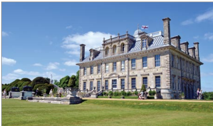
A Bankes család kastélya Kingston Lacy-ben