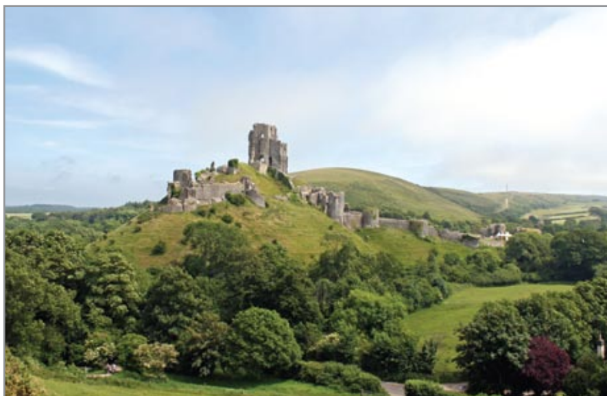
A vár látképe, egy délnyugati magaslatról

Corfe várának fontos szerep jutott a középkorban, hiszen számos uralkodó királyi rezidenciájaként szolgált. János Király (Földnélküli János) még itt tartotta a koronaékszereket is. Ám a középkor kegyetlenségei és vérengzései a várat sem kerülték el központi szerepe miatt: bebörtönzések és kínzások helyszíne lett Corfe. III. Henrik és fia, I. Edward azonban a vár lakóinak kényelmére és biztonságára is figyelmet fordítottak, és a lakóterek felújításával, valamint a védművek korszerűsítésével javítottak az életkörülményeken. A vár utolsó uralkodói tulajdonosa VIII. Henrik lánya, I. Erzsébet volt, aki kedvenc kancellárjának, Christopher Hattonnak adta el a birtokot, melyet évtizedekkel később a Bankes család vásárolt meg.