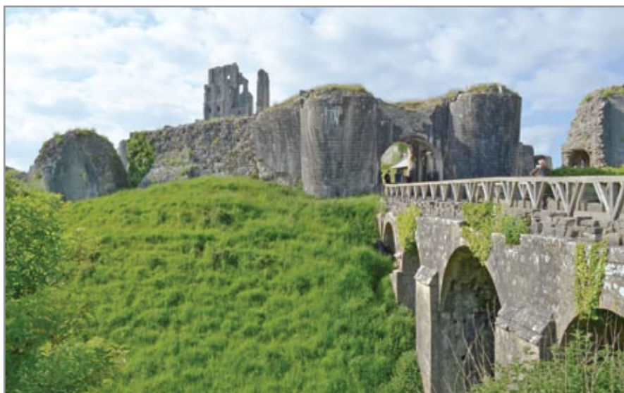
Az alsó vár bejárata a híddal és a kaputorony maradványával