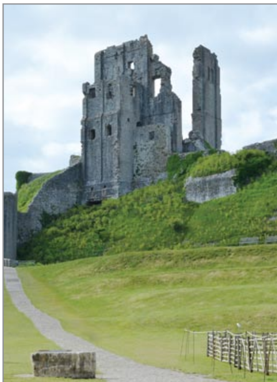
Az öregtorony többemelet magas romjai az alsó vár felől