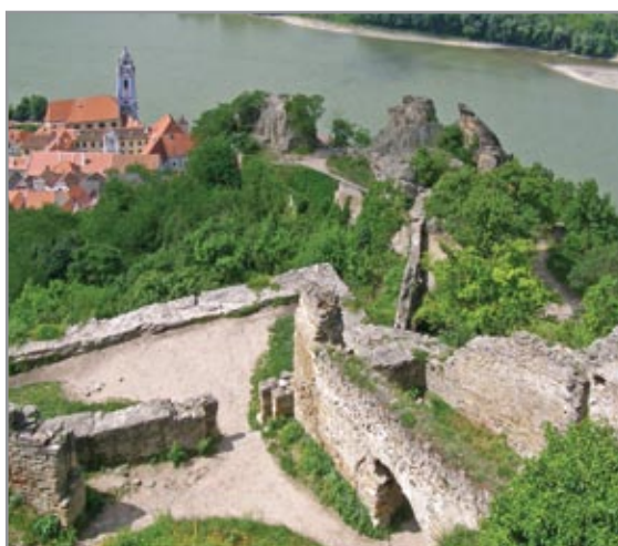
Az alsó és középső vár látképe a felső várból