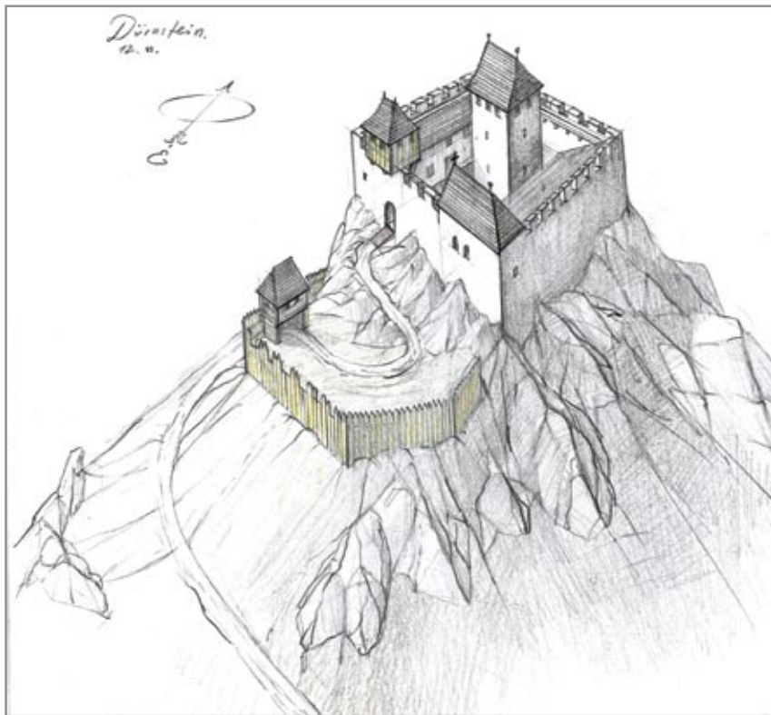
Dürnstein vára a 12. században. Kőnig Frigyes rekonstrukciós elképzelése

I. (Oroszlánszívű) Richárd angol király (uralkodott 1189–1199), a harmadik keresztes hadjárat egyik fővezére, 19. századi olajfestményen