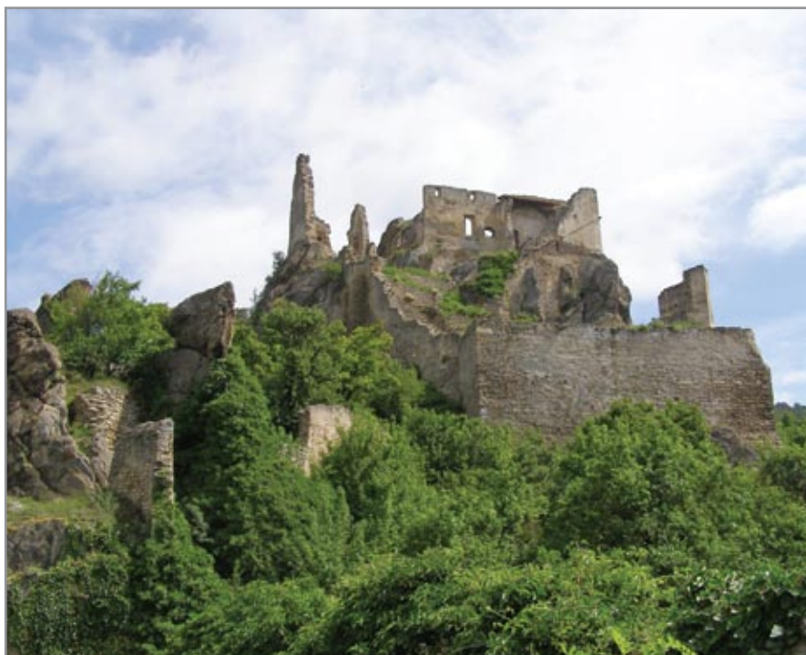
A felső vár dél felől, az alsó várból fotózva

Vajon hol raboskodhatott az angol király? Ma már nehezen lehetne eldönteni. Talán nem tévedünk túl nagyot, ha úgy véljük, ennek helyszíne a vár felső szintjén, az ő korában már feltétlenül meglévő toronyban, esetleg a palota valamelyik helyiségében volt. De akárhol tartották is fogva, tény, hogy Dürnstein vára ettől az eseménytől örökre elhíresült; legfőbb vonzereje manapság is Oroszlánszívű Richárd király emléke. 🍷