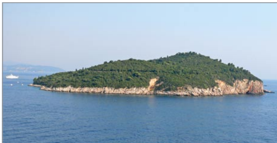
Lokrum szigetének partjainál szenvedett Oroszlánszívű Richárd hajótörést. Az általa alapított bencés kolostor romjai ma is láthatóak

alakja is könnyen felismerhetővé tette. A fegyveresek vezetője – Otto von St. Blasien krónikája szerint – így szólt hozzá: álljon fel onnan uram, már így is túl sokáig időzött ezen a méltatlan helyen!