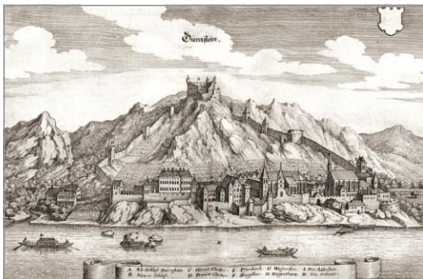
Dürnstein látképe 1679-ben (M. Merian rézmetszete)

Az egyik ilyen történet Lipót herceg leányáról szól, aki egy alkalommal véletlenül megpillantotta a rab uralkodót és azonnal beleszeretett. Eleinte csak étellel itallal, valamint különleges édességekkel kedveskedett szerelmének, majd egy éjszaka fegyverhordozónak öltözve a szobájába is belopódzott. A légyottnak hamarosan híre ment és Lipót éktelen haragra gerjedt. Főbírája tanácsára a vadsparkjában tartott, kiéheztetett oroszlánt szabadította foglyára. Richárd azonban a rárontó oroszlán elől félreugrott és közben hatalmasat ütött rá. Az állat felüvöltött fájdalomában