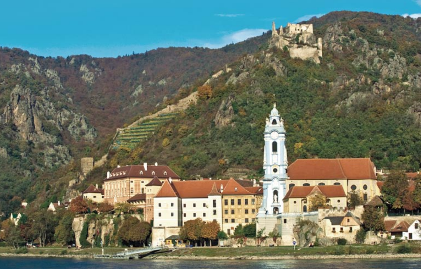
Dürnstein távlati képe a Duna partjáról