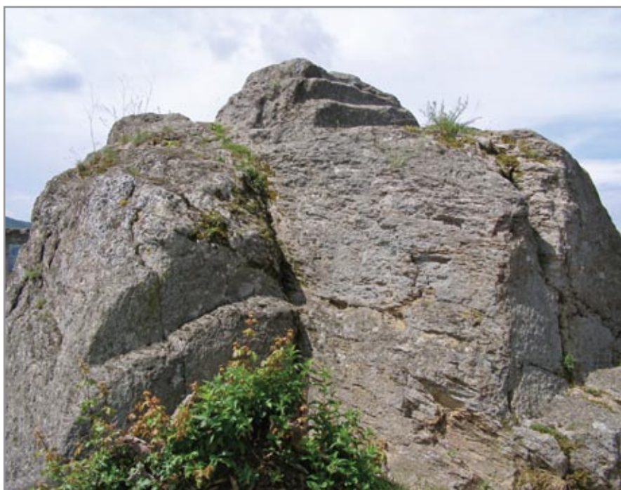
A felső várban, ezen a sziklán állt egykor az a lakótorny, amelyben a feltételezések szerint Oroszlánszívű Richárdot fogva tartották